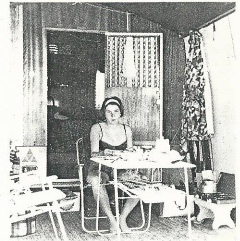
Gemütliches Frühstück im geräumigen Vorzelt

chen“ ist auch vielen Großstädtern, daß dieser Wagen auch quer oder hochkant an die Garagenwand geschoben werden kann und damit nur wenig Platz für sich in Anspruch nimmt. Allen interessierten Campern empfehlen wir daher, sich mit der Firma Kurt Scholz, 506 Bensberg, Kölner Straße 96, in Verbindung zu setzen. Diese wird sicherlich so freundlich sein, Ihnen ein entsprechendes Angebot zu unterbreiten sowie alle Ihre Fragen zu beantworten.