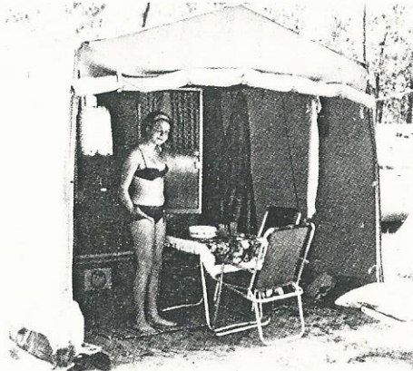
„Brüderchen“ aufgebaut mit Vorzelt

Einer der Gründe des Erfolges dieses Wohnanhängers ist seine stabile Holzverarbeitung, bei der im aufgefalteten Zustand der größte Teil der senkrechten Wände starr aus Holz gebildet werden. Besonders augenfällig ist bei diesem Wagen die Geräumigkeit. Die neue Variante des „Brüderchens“, bei der ein Doppelbett eingebaut werden kann, ermöglicht, daß Parterre drei Personen bequem schlafen können. Hinzu kommt dann noch die Möglichkeit, zwei weitere Schlafplätze mit Hilfe von Einhängbetten zu schaffen. Bei der konventionellen Form, bei der jeweils ein Bett rechts und links auf den geräumigen Stau-