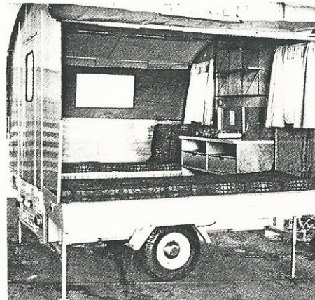
Seitenansicht bei aufgestelltem Wagen

truhen aufgebaut ist, kann mit Hilfe von Luftmatratzen im Mittelgang ein weiterer großer Schlafplatz für zwei Personen geschaffen werden. Der rührige Importeur, der sich ständig um den Ausbau dieser Wagen bemüht, hat auch einen Gepäckträger entwickelt, mit dessen Hilfe dieser Klappanhänger zugleich auch als Bootsanhänger oder auch werktags als Transportanhänger zu benutzen ist, ohne daß das „Innenleben“ entfernt werden muß. Sympathisch am „Brüder-